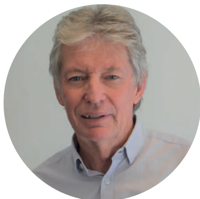
Hugo Abel Sager Ex Diputado